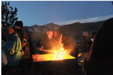
Encenent el foc en el moment de la posta. Penyes Altes de Moixeró al fons. Bagà.

Les fotografies més antigues conservades