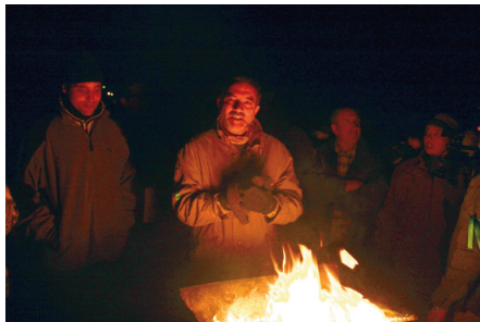
Explicant la tradició.