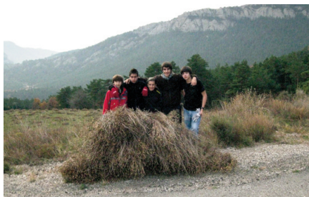
Collita de faia. Es feia a partir de l'11 de novembre, Sant Martí.