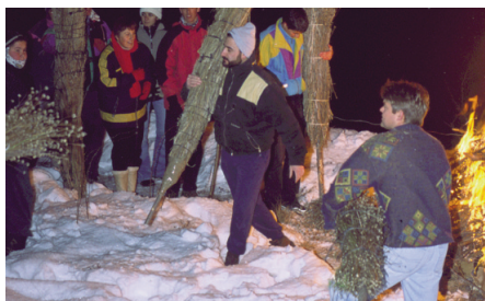
Prop del foc abans d'encendre a Cerdanyola.