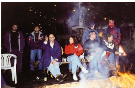
Joves durant la nit a Sant Julià de Cerdanyola. "L'Endreça".

Aquest text es correspon amb el de la memòria presentada perquè la Fia-faia fos reconeguda com a festa patrimonial d'interès nacional, i no havia esta publicat anteriorment. A les 10es Trobades Culturals Pirinenques se n'exposà un resum i s'acompanyà d'un Power Point per a la millor comprensió de la festa. Les fotografies del Power acompanyen aquest article; l'ordre i els peus de foto permeten fer-se idea de la festa i tenen entitat per elles mateixes. Les notes són afegides en aquesta versió, per situar el lector i actualitzar el contingut sense modificar l'original.