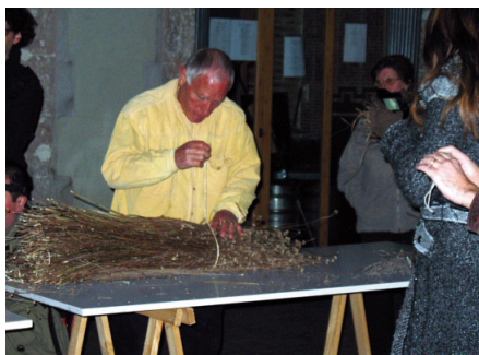
La confecció de les faies requereix habilitat.