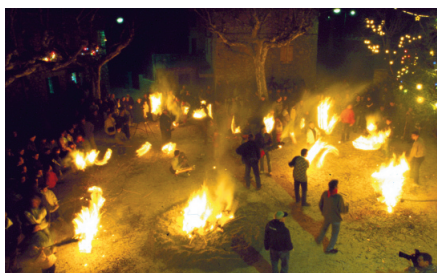
Crema general a Sant Julià de Cerdanyola.