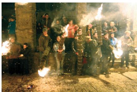
Crema general a Bagà. Vista parcial.