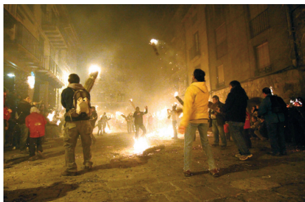
Llançament de faies a Bagà.