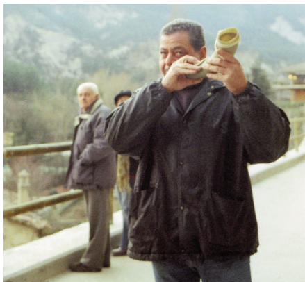
El toc de corn aplega els fallaires adults per pujar a la muntanya.

metres. Sorpren la durada d'aquestes torxes en cremar, a més de ser molt lleugeres pel seu volum. Les persones més grans, habitualment els avis, confeccionen les faies i n'ensenyen a fer als més petits. Hi ha lleugeres diferències en la manera de fer-la entre Bagà i Cerdanyola. 4