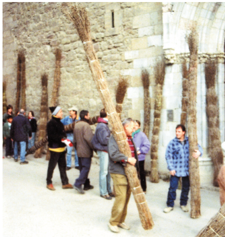
Faies aplegades davant el temple parroquial a Bagà.

Tan arrelades estaven aquestes celebracions