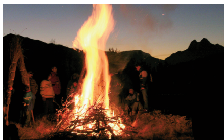
Encenent el foc en el moment de l'ocàs, Pedraforca al fons. Sant Julià de Cerdanyola.